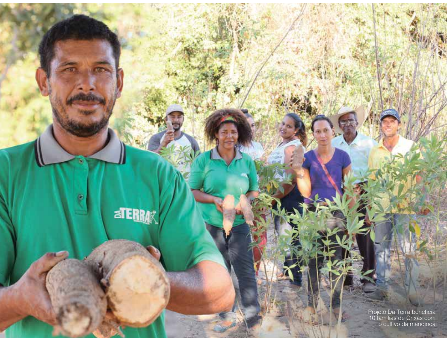
Projeto Da Terra beneficia 10 famílias de Crixás com o cultivo da mandioca

Os membros da Associação dos Moradores do Setor Santos Reis criaram uma confecção com foco na produção de uniformes. Seis famílias foram beneficiadas, totalizando 24 pessoas. A confecção presta serviço para a AngloGold Ashanti, produzindo uniformes.