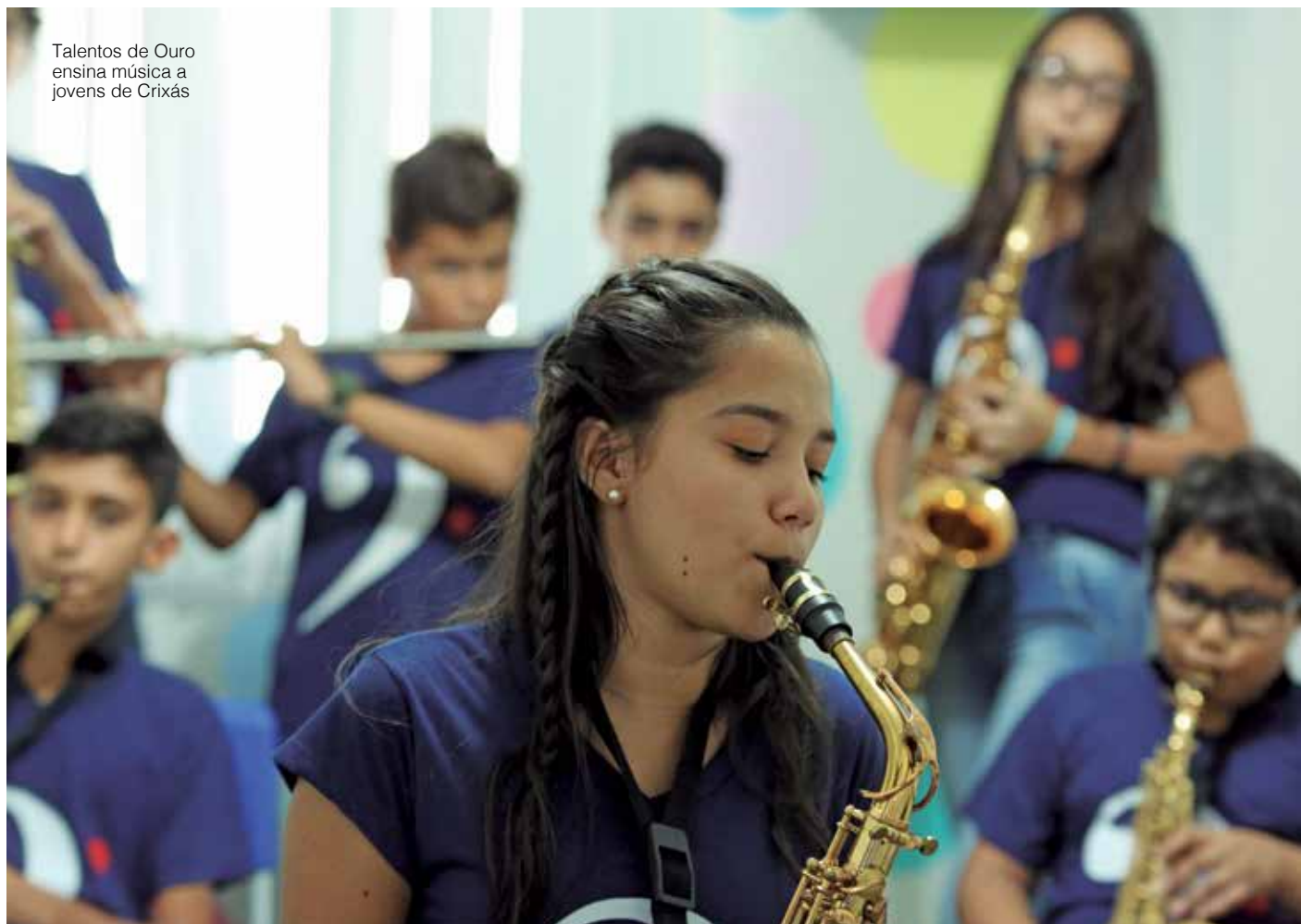
Talentos de Ouro ensina música a jovens de Crixás

Patrocinado pela AngloGold Ashanti, com o apoio da Prefeitura de Crixás, e realizado pelo Sindicato dos Trabalhadores nas Indústrias Extrativas do Vale do Rio Crixás, o projeto beneficiou 160 jovens, de 8 a 14 anos, em 2018 (Lei de Incentivo ao Esporte).