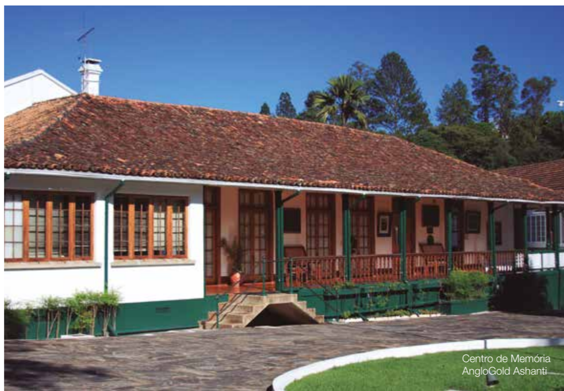
Centro de Memória AngloGold Ashanti