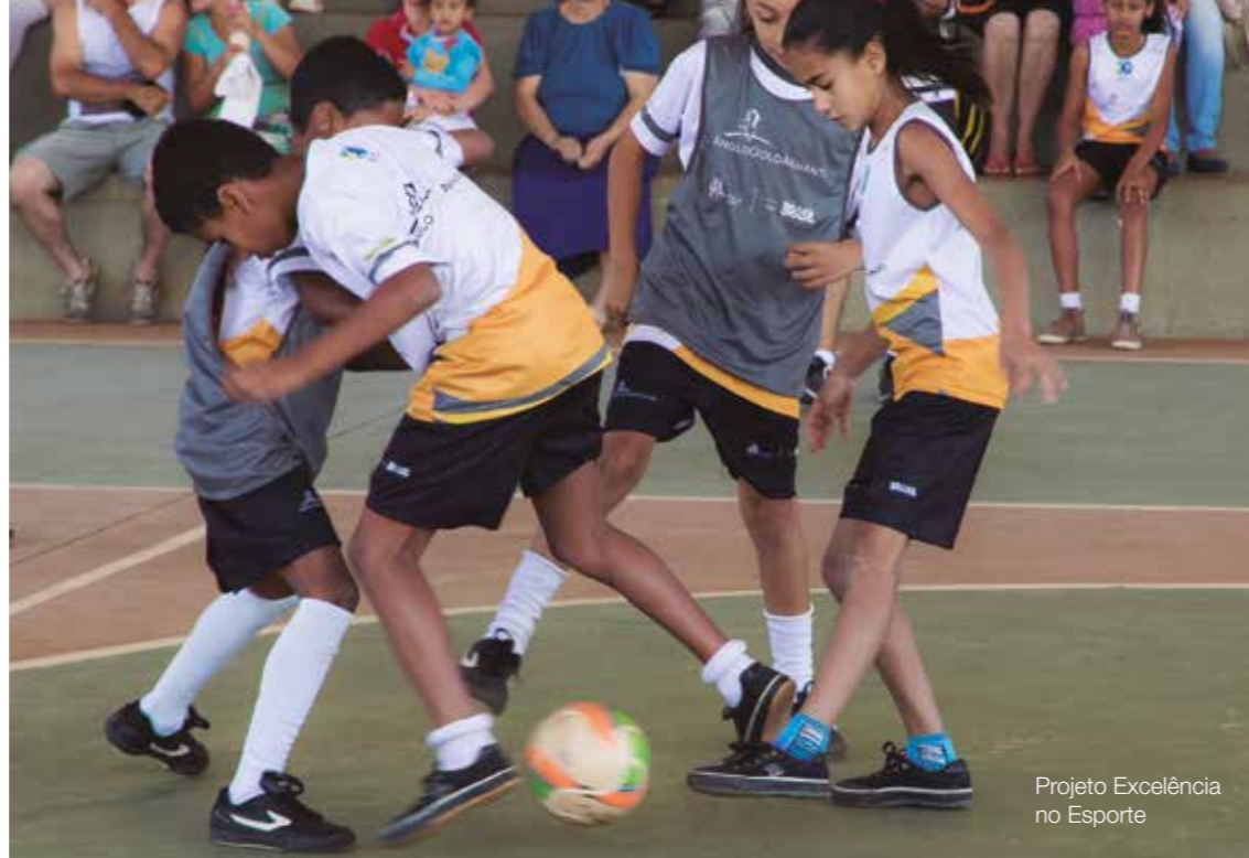
Projeto Excelência no Esporte

R$ 357 MIL INVESTIDOS EM AÇÕES DE PRESERVAÇÃO DA MEMÓRIA