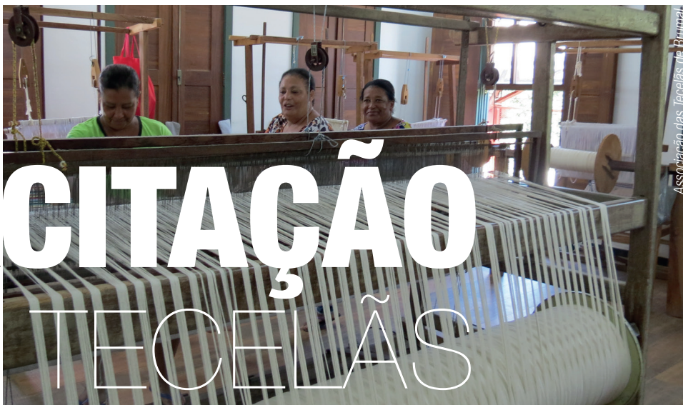
Associação das Tecelãs de Brumal

Em um primeiro olhar, a Associação das Tecelãs de Brumal, sediada em Santa Bárbara, pode parecer apenas um espaço dedicado à criação de peças de tear. Mas ela vai muito além disso, sendo também responsável por impulsionar e registrar os bens culturais da região. A próxima empreitada da instituição será a coleção Nas Tramas da Cavallhada, inspirada no mais importante ativo cultural do distrito de Brumal.