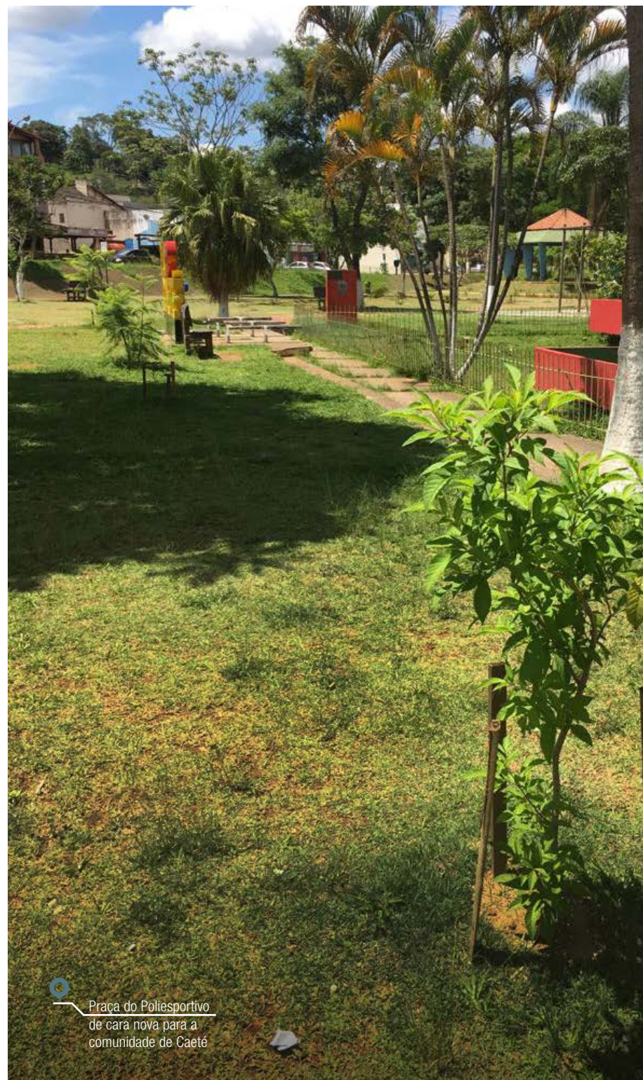
Praca do Poliesportivo de cara nova para a comunidade de Caeté

As mudas foram plantadas por 80 voluntários, entre empregados da AngloGold Ashanti, seus familiares, amigos e pessoas da comunidade e do poder público. A escolha do ipê amarelo é uma simbologia ao ouro e marca a chegada das operações da empresa à cidade. Além do plantio das mudas, foi instalado o letreiro “Eu amo Caeté”, que permite que a comunidade e os turistas registrem sua passagem e o seu carinho pela cidade.