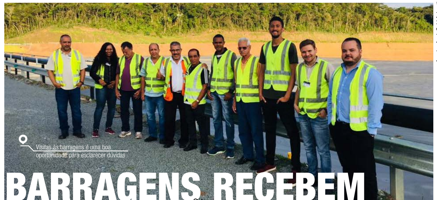
Visitas às barragens é uma boa oportunidade para esclarecer dúvidas

Para manter o compromisso com a segurança, foi realizado no dia 25 de março, o quarto teste de sirene. Na oportunidade, a comunidade de Pompéu pôde ver o sinal luminoso e ouvir o sinal sonoro e a mensagem de voz. Esses dispositivos