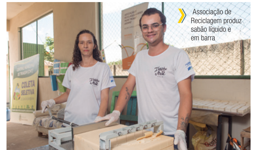
Associação de Reciclagem produz sabão líquido e em barra

O apoio ao empreendimento permitiu a contratação de cursos de costura, com destaque para as aulas de macramê – tipo de nó usado para criar franjas e bordados –, a compra de materiais para produção, uma máquina de bordar, móveis, além da instalação de conexão à internet. Foram criados, ainda, uma coleção com o tema “Estrada Real”, inspirada pela oficina de design de produto, e um catálogo virtual com os produtos.