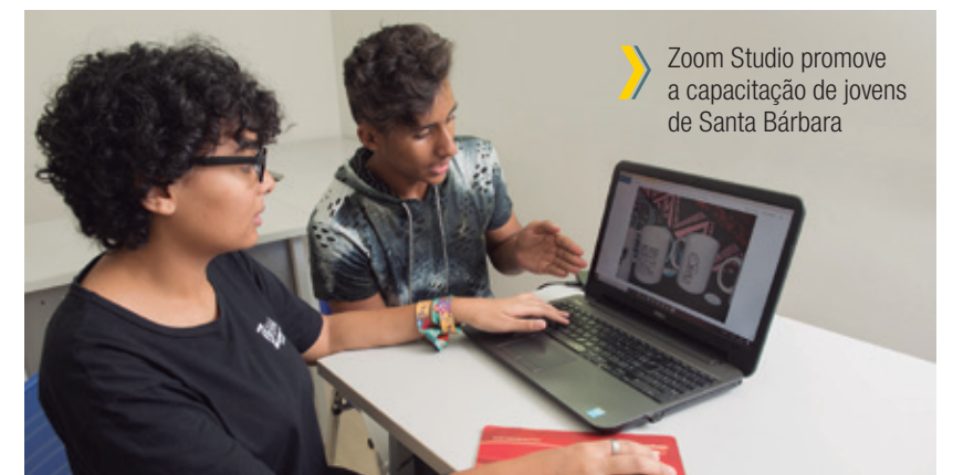
Zoom Studio promove a capacitação de jovens de Santa Bárbara

A produtora digital promove a capacitação de jovens de Santa Bárbara e oferece serviços audiovisuais. O recurso repassado viabilizou a oferta de oficinas de fotografia, edição de vídeo, roteiro e animação à equipe e custeou a aquisição de computadores, câmera fotográfica, lentes, tripés, kit de iluminação, microfones, tablet , teleprompter e escuta de ouvido.