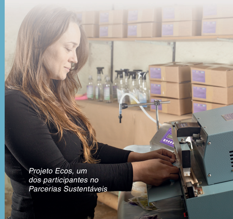
Projeto Ecos, um dos participantes no Parcerias Sustentáveis