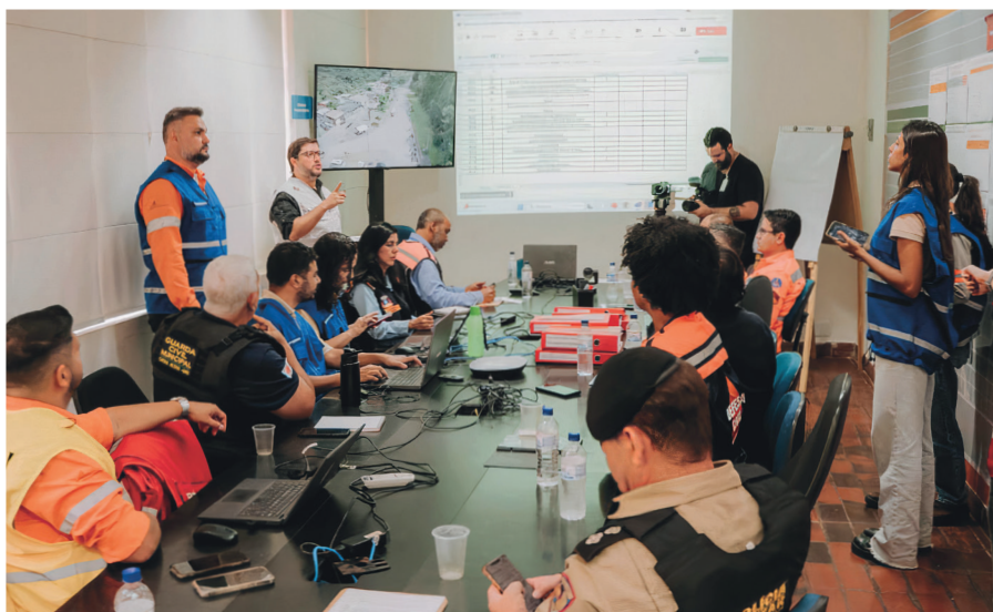
AngloGold Ashanti e poder público realizaram o exercício de emergência com a participação da comunidade.

Instituto AGA apoia programas esportivos para crianças e jovens.