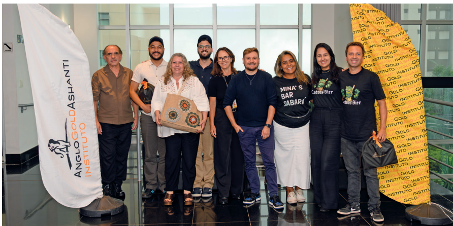
Empreendedores de Sabará e Caeté selecionados para a 16ª edição do Programa Parcerias Sustentáveis.

Empreendimentos de Caeté e Sabará foram selecionados para a 16ª edição do Parcerias Sustentáveis, uma iniciativa do Instituto AngloGold Ashanti voltada para o fortalecimento do empreendedorismo social nas cidades em que a empresa atua.