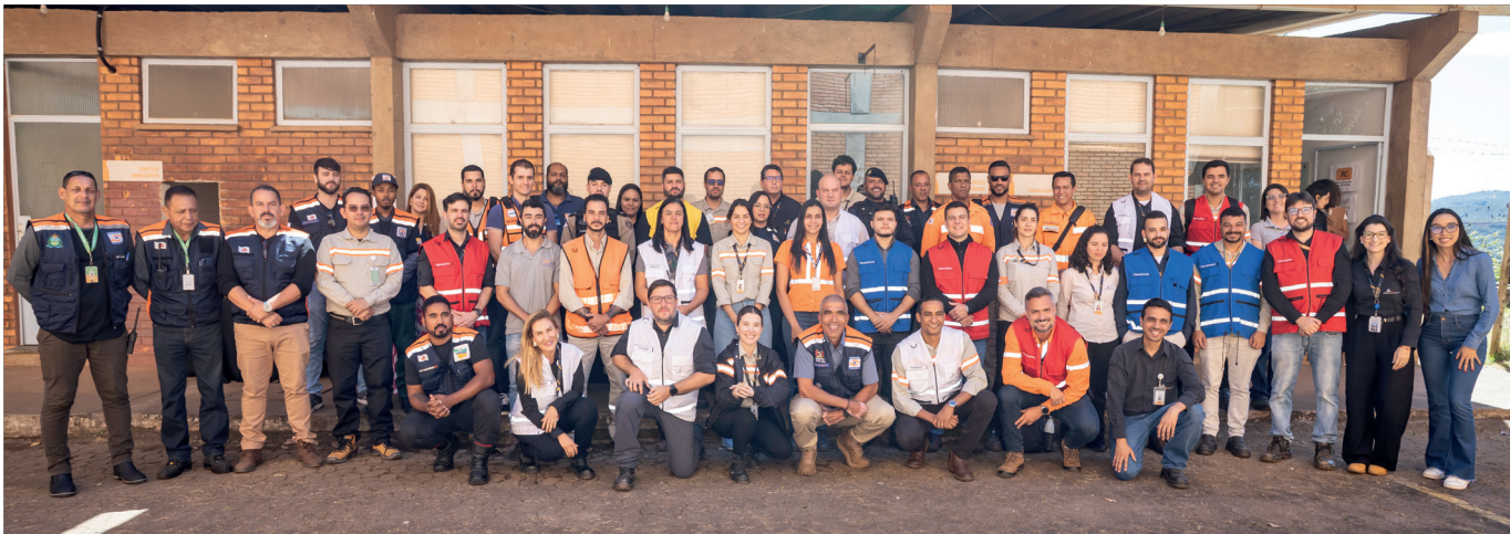
Ações do PAEBM reforçam a prevenção e a preparação para situações de emergência, com foco na segurança das comunidades.

A segurança é o principal valor para a AngloGold Ashanti e o alicerce do nosso relacionamento com as comunidades que nos hospedam. Neste contexto, o Plano de Ação de Emergência para Barragens de Mineração (PAEBM) não apenas orienta as decisões de nossos empregados em situações emergenciais, mas também estabelece o papel fundamental de todos aqueles que convivem no território, integrando empresa e comunidade em um esforço mútuo de prevenção.